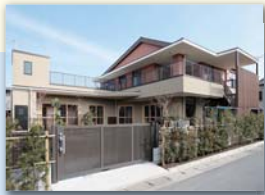
にんじん村保育園