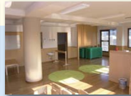
ナーサリースクールT & Y改修