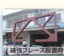
補強プレート設置時