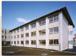
南毛利中学校北棟校舎改築