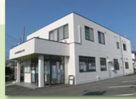
J A あつぎ北支店増築