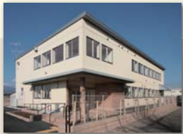
わかばデイサービスセンター