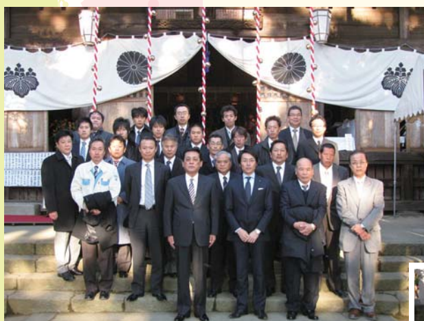
新年1月5日 相模國三之宮比々多神社参拝