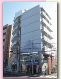
ピア吉野外部改修