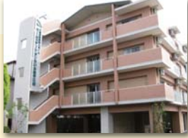
有料老人ホーム ホームステーションらいふ愛甲石田